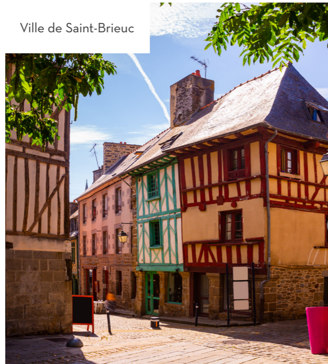
Ville de Saint-Brieuc