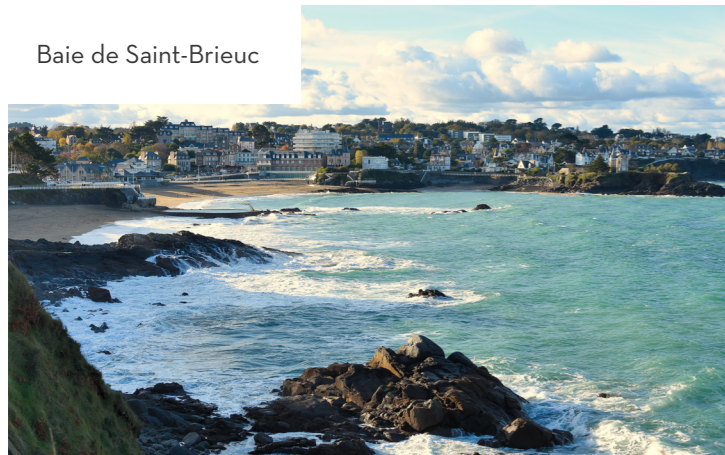
Baie de Saint-Brieuc